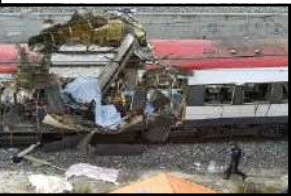
11 mars 2004 à MADRID

Ce matin du 11 mars 2004 ce sont 10 bombes sur 13 qui ont explosé dans les